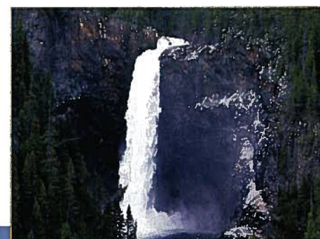
Chute de la rivière du Bras Pilote (Première nation innue d'Essipit)