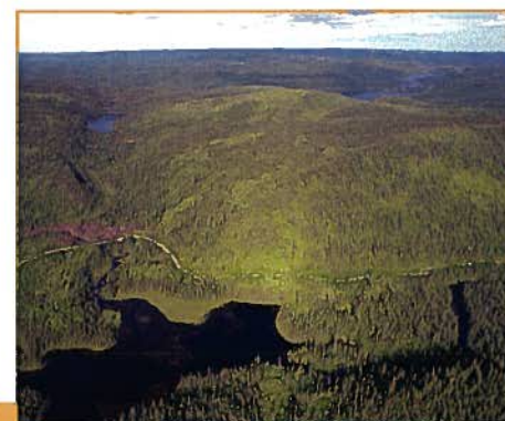
Le lac Pilote et le Bras Pilote avec le lac Brûlé à l'arrière-plan