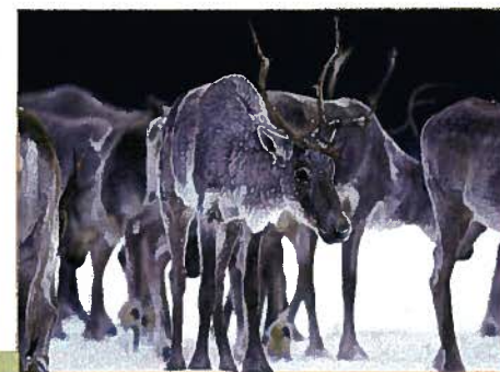
Caribou forestier (MNRN)